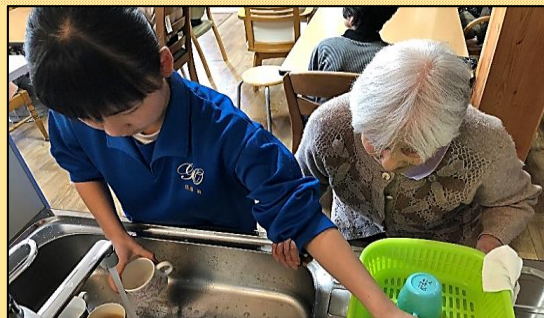
ご利用者といっしょに家事活動!

ぷらすは一とでは、今後も福祉体験等を積極的に受け入れ、地域に根ざしたホームを目指していきたいと考えます。