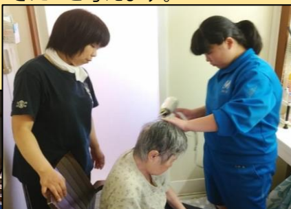
お風呂上りにスタッフといっしょに!