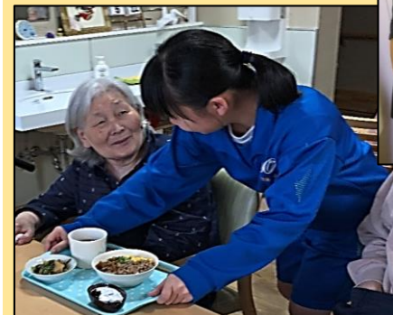
笑顔で配膳してくれました。ご利用者もにっこり!