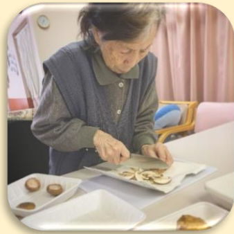
ご利用者と昼食の準備中！