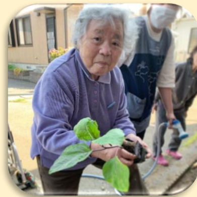
ホーム内の庭園で野菜の苗を植えました🌱🌱