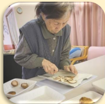
ご利用者と昼食の準備中！